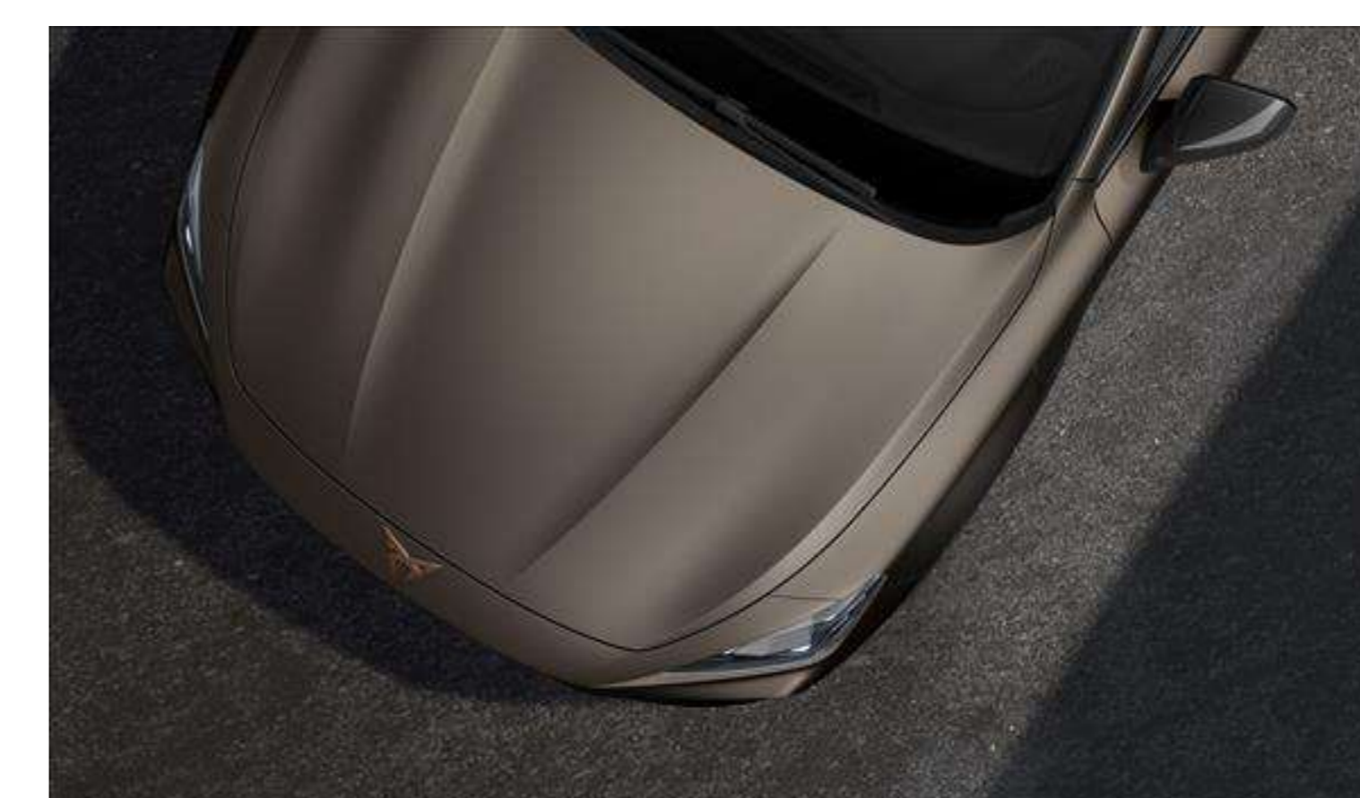
Century Bronze Matt 1