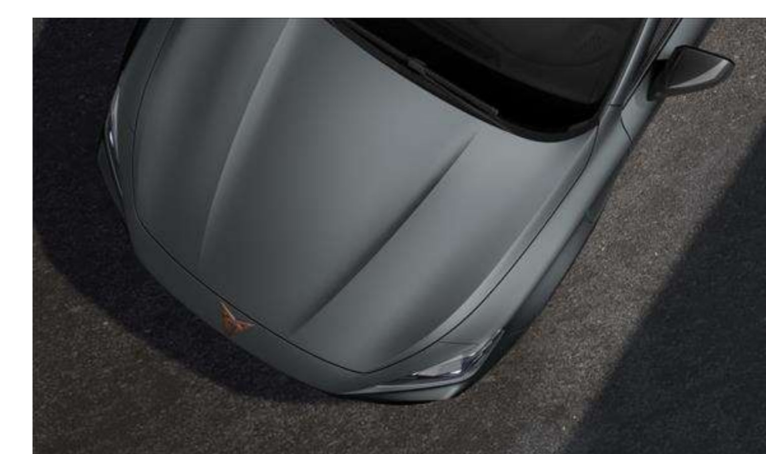
Enceladus Grey Matt 1