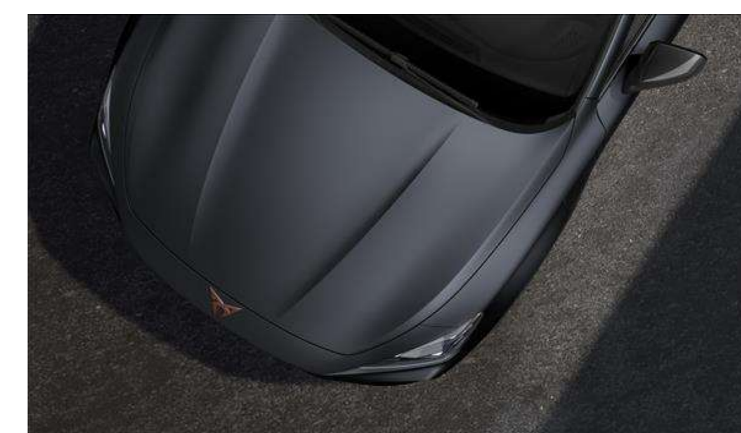
Magnetic tech Matt