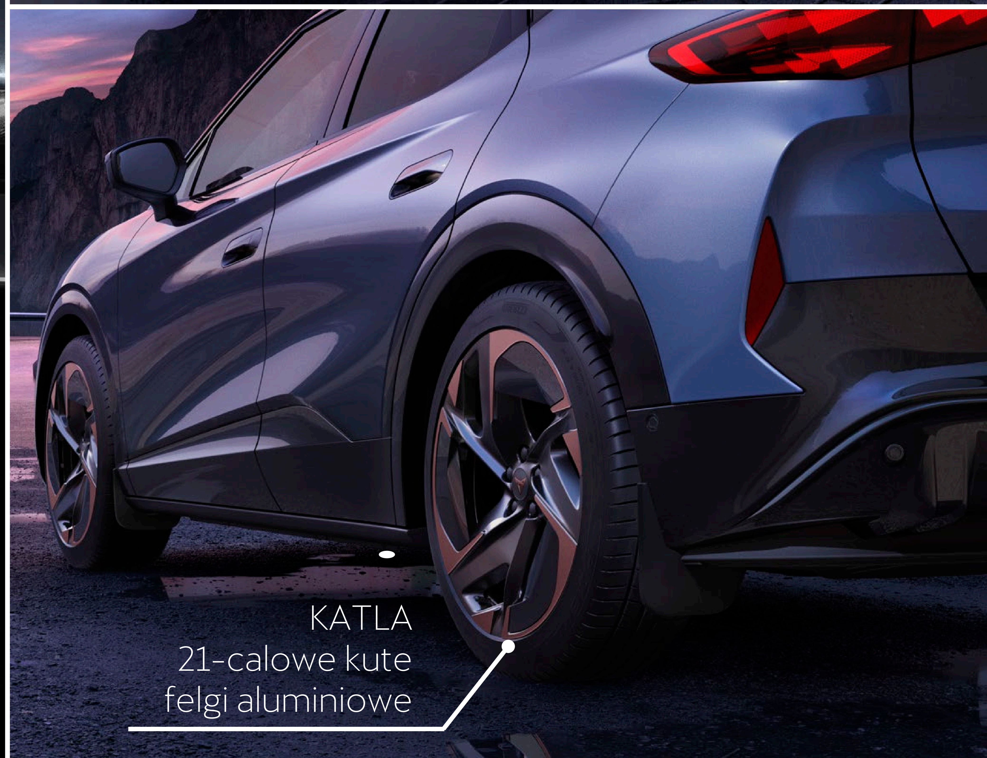
KATLA 21-calowe kute felgi aluminiowe