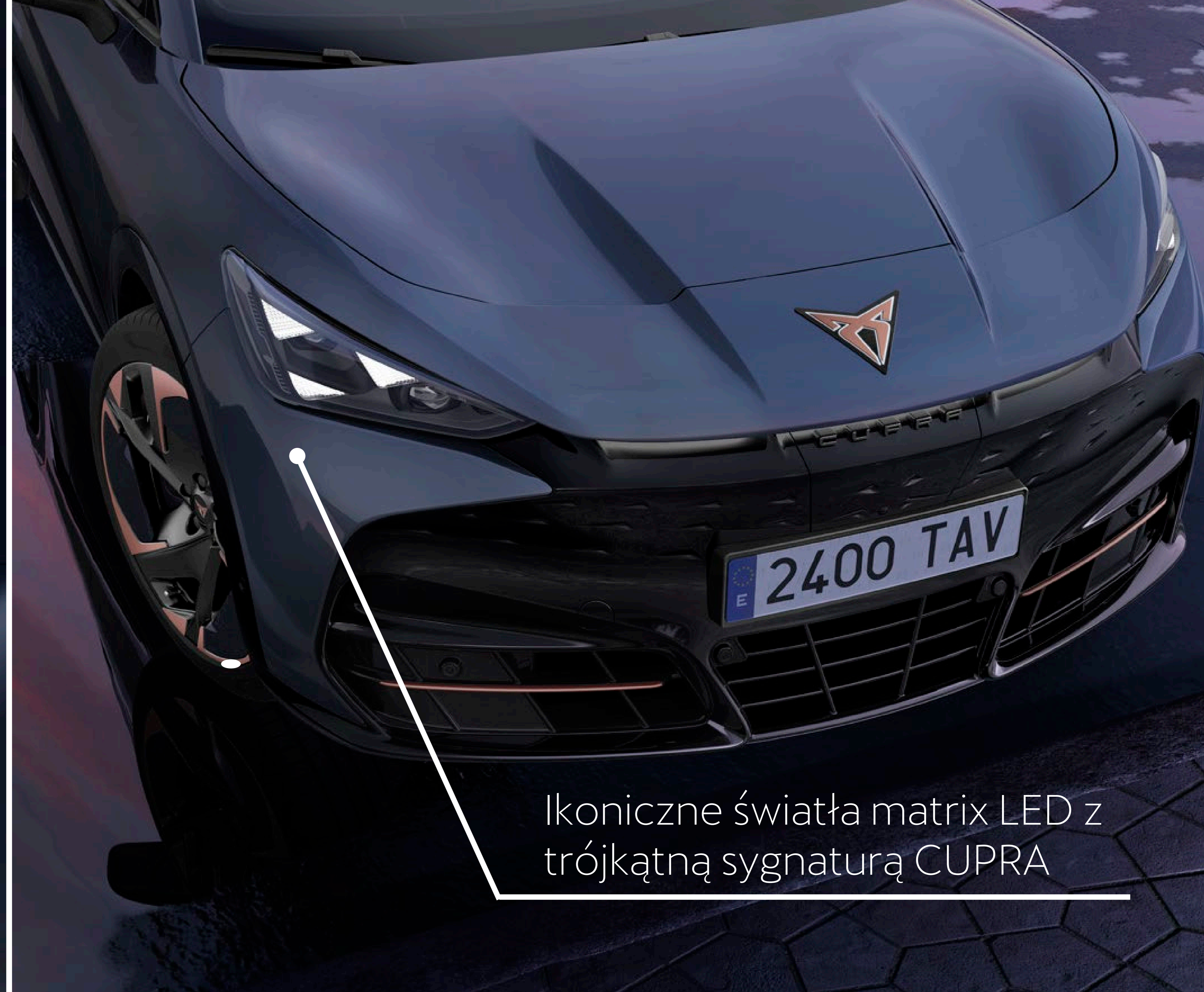
Ikoniczne światła matrix LED z trójkątną sygnaturą CUPRA