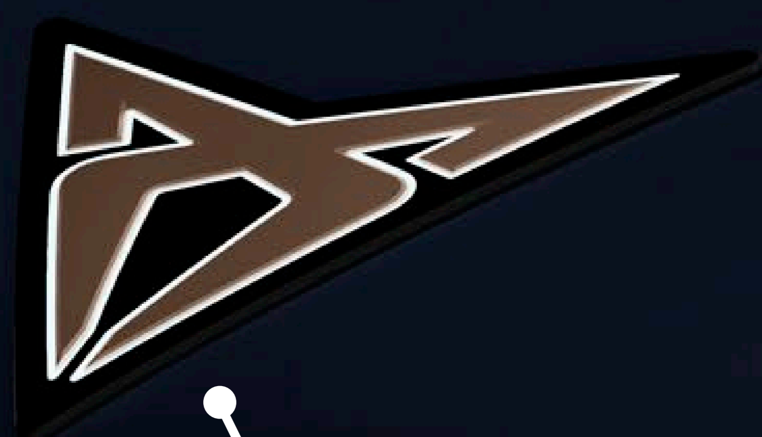
Podświetlane logo CUPRA

NOWY KIERUNEK STYLISTYCZNY I WYJĄTKOWY DESIGN MARKI CUPRA