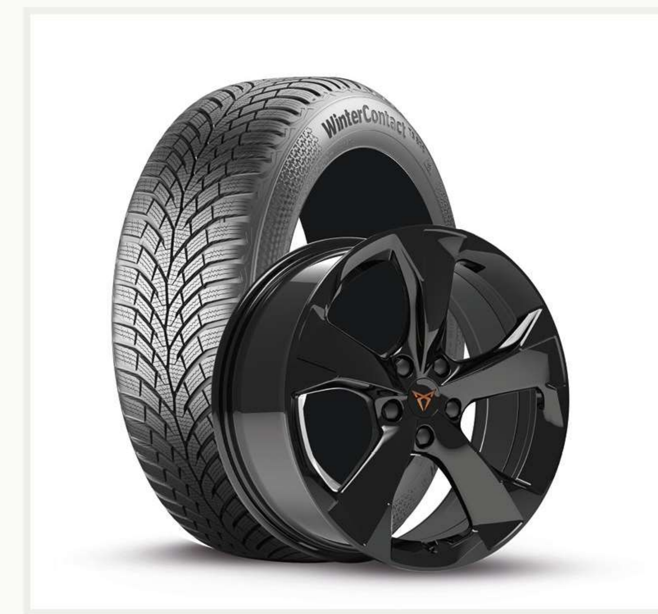
KOŁA ZIMOWE Już od 7500zł