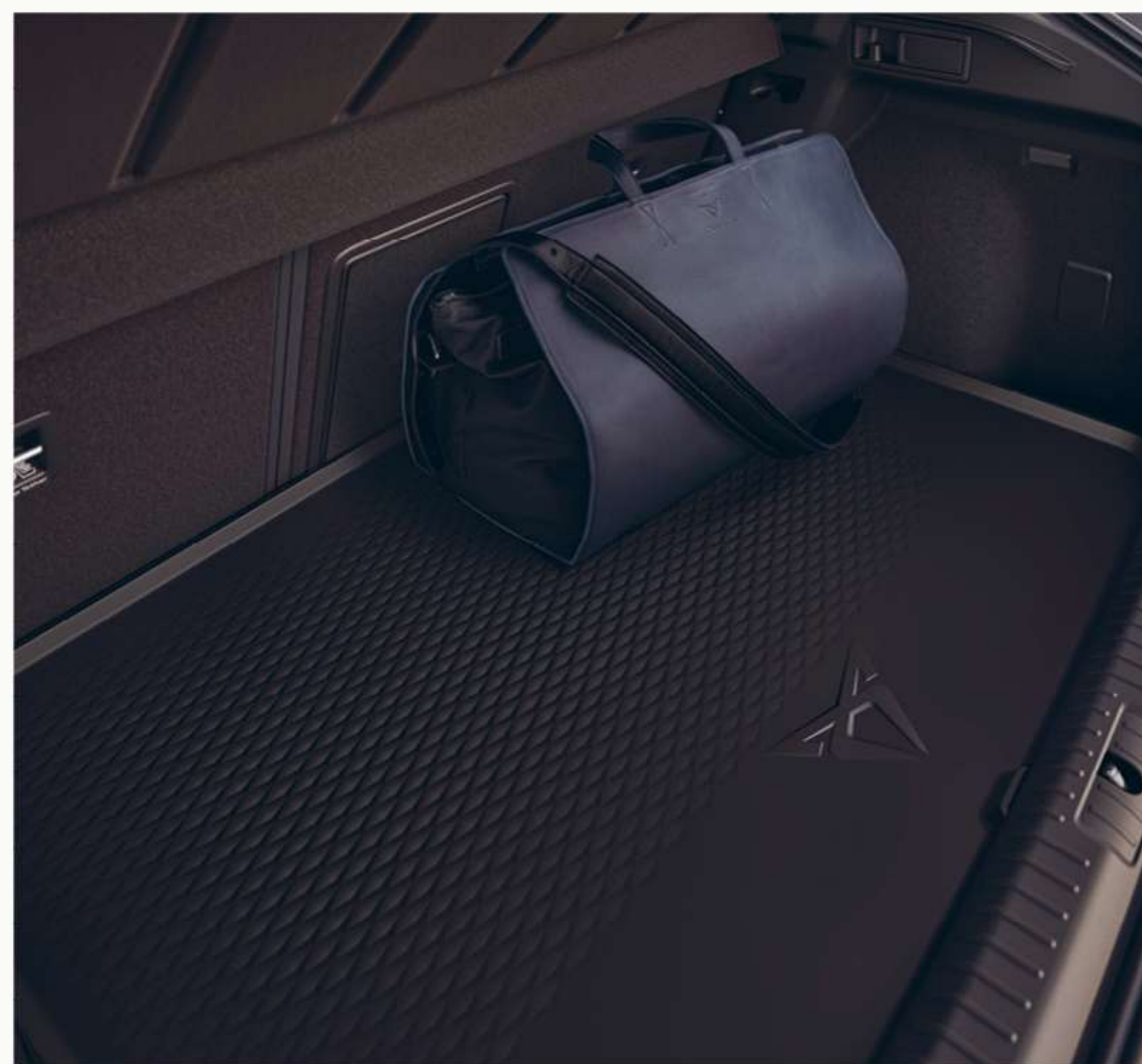
MATA BAGAŻNIKA Już od 359zł