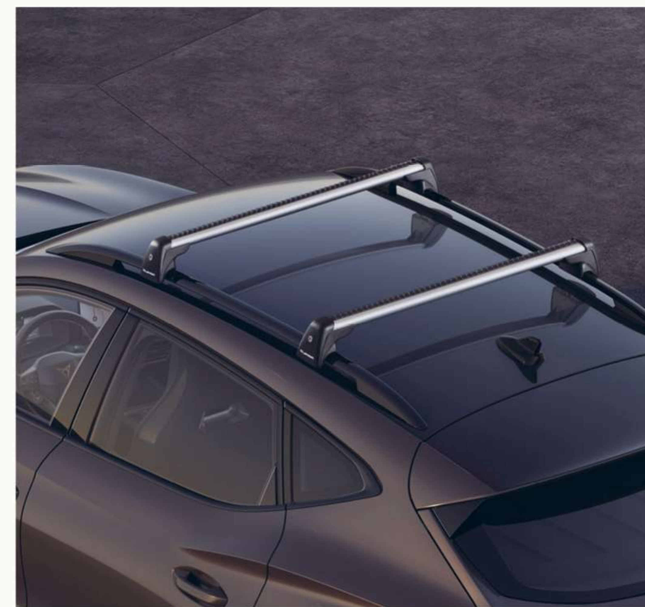
BELKI DACHOWE Już od 1 199zł